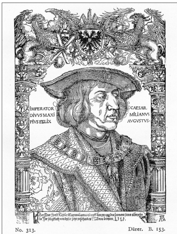
Albrecht Dürer: I. Miksa császár arcképe