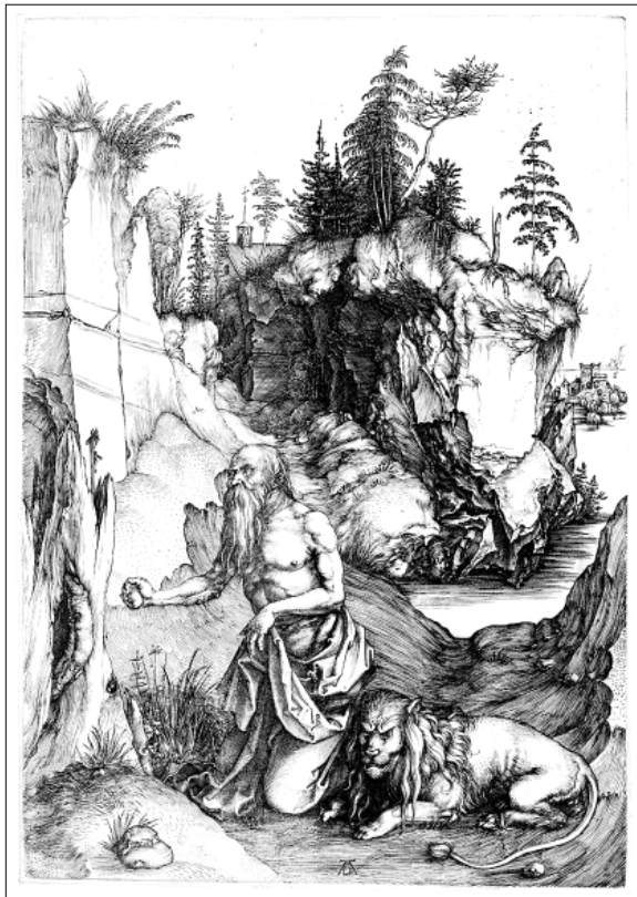
Albrecht Dürer: Szent Jeromos (Szépművészeti Múzeum, Grafikai Osztály, Ltsz.:500)