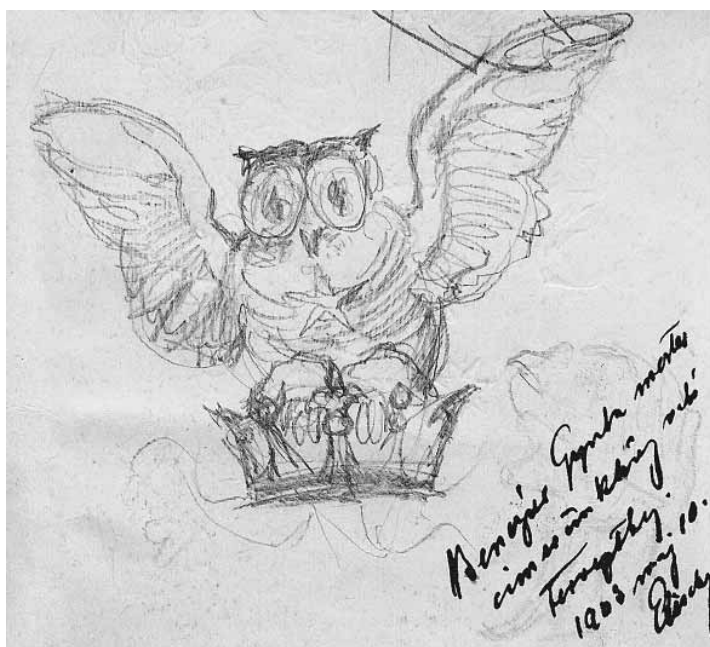
Benczúr Gyula tervrészlete az Elischer címert (mgt.)