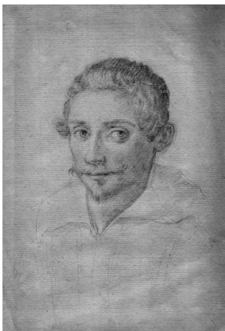
Ismeretlen művész: Férfi portré (mgt.)