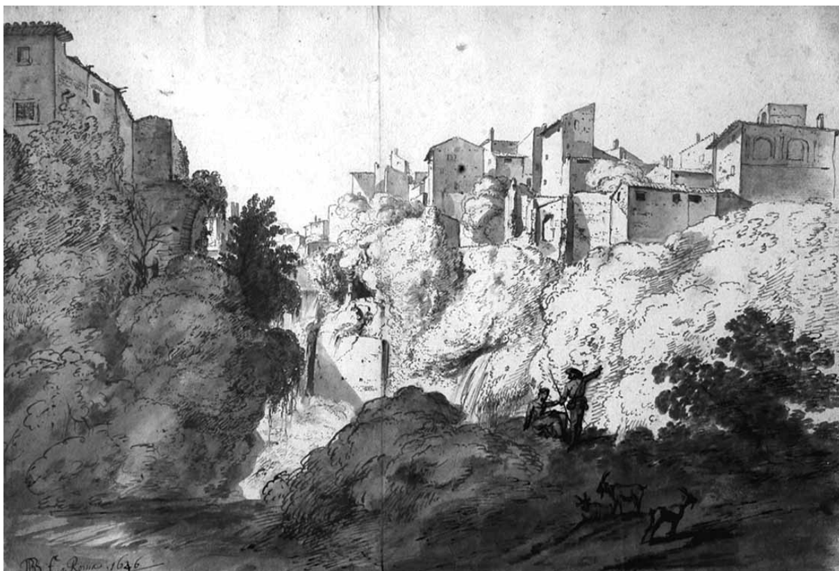
Bartholomeus Breenbergh: Tivoli táj pásztor párral (mgt.)